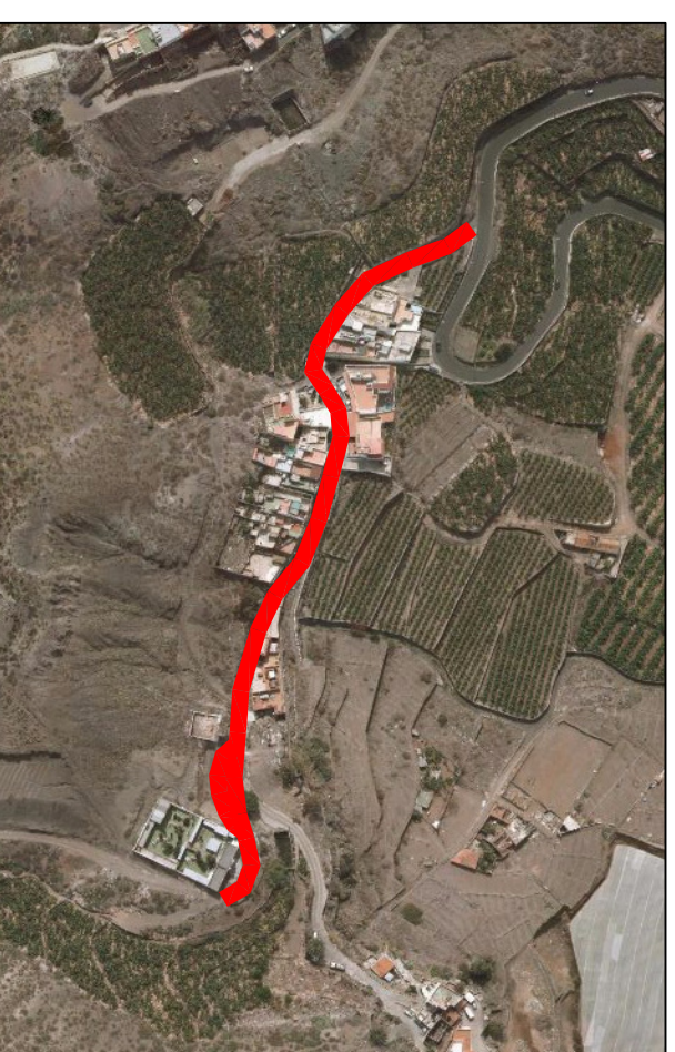
BAÑADEROS, PLANO 4