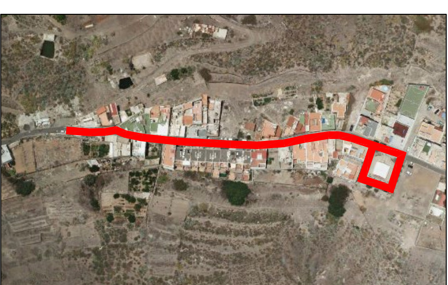
LOMO QUINTANILLA, PLANO 3