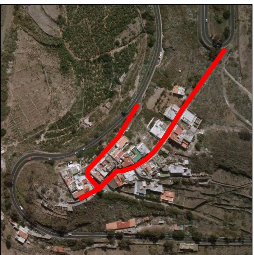
SAN FRANCISCO JAVIER, PLANO 11