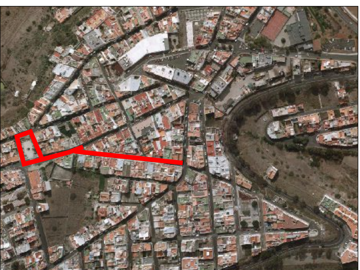
SANTIDAD, PLANO 9