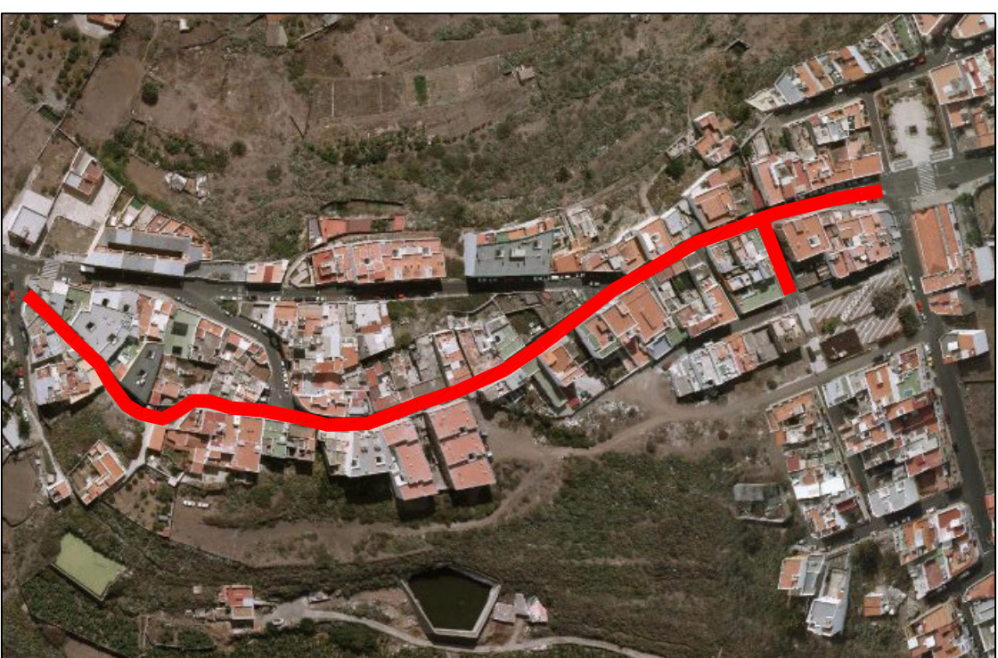
SANTIDAD, PLANO 8