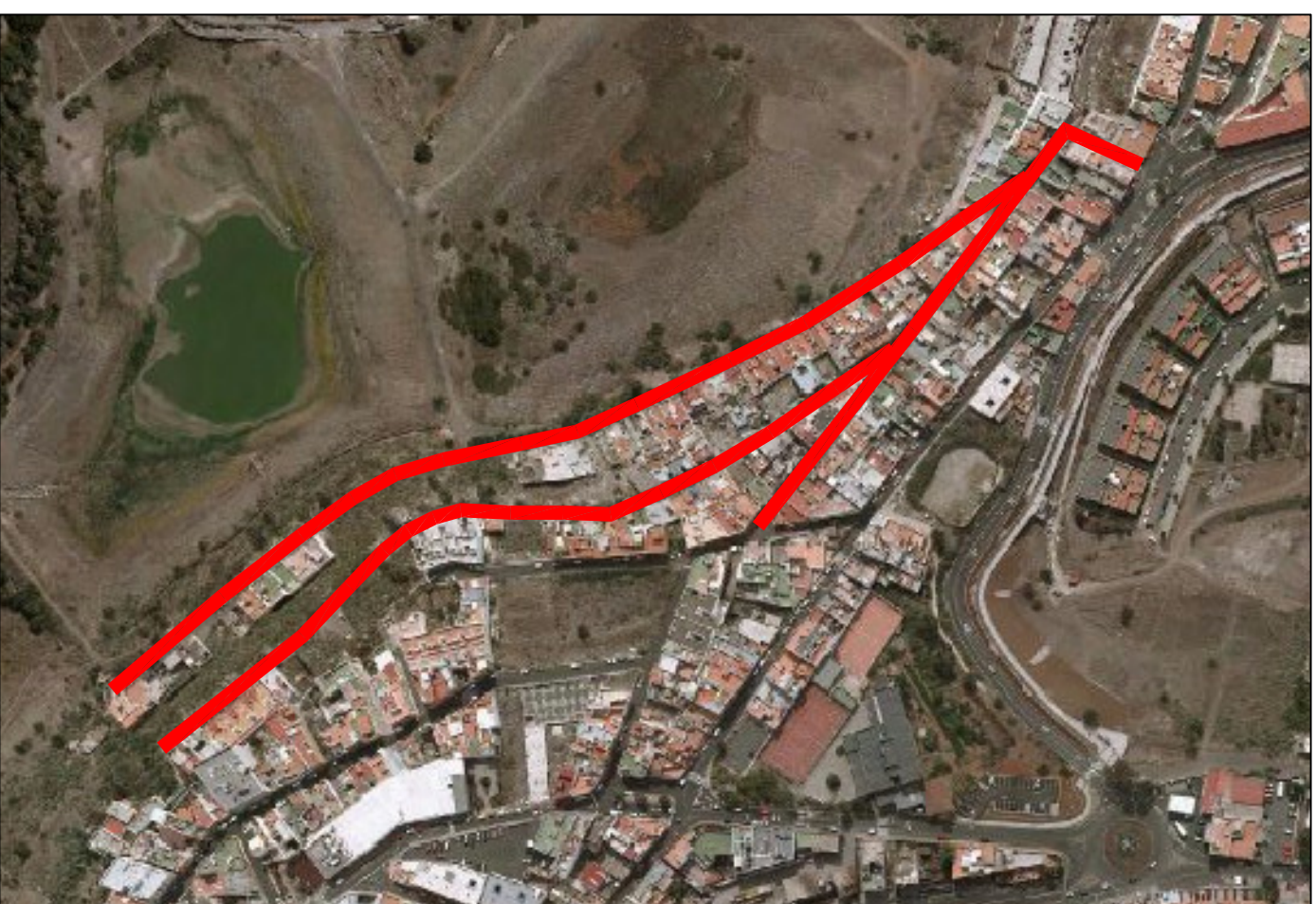
SANTIDAD, PLANO 10