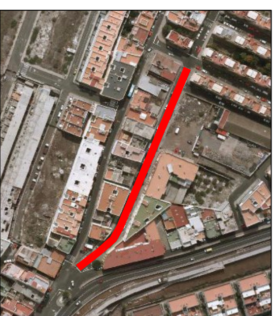
JUAN XXIII, PLANO 7