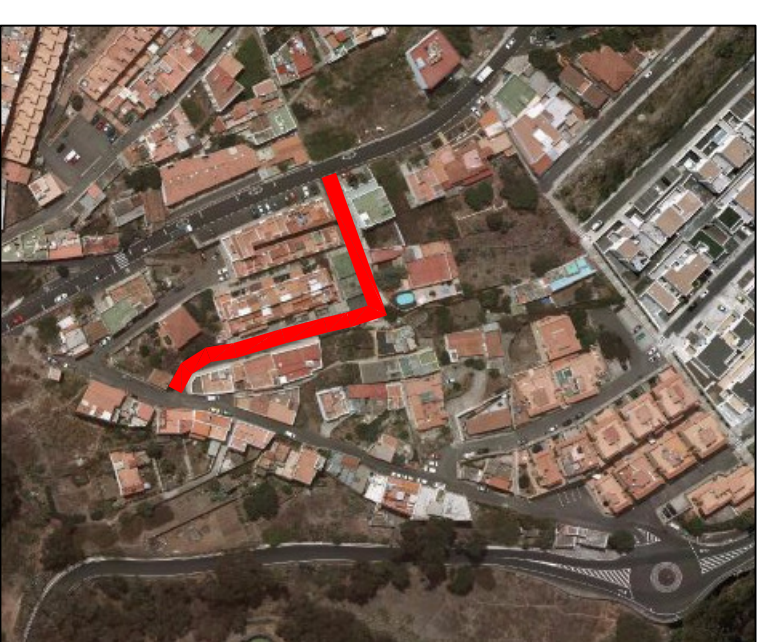
LOS PORTALES, PLANO 12