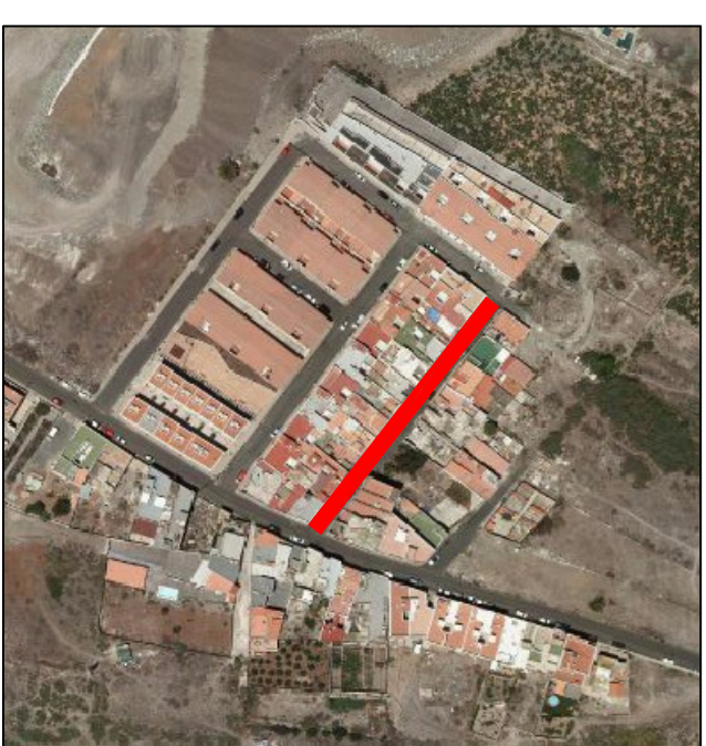
LOMO ESPINO, PLANO 6