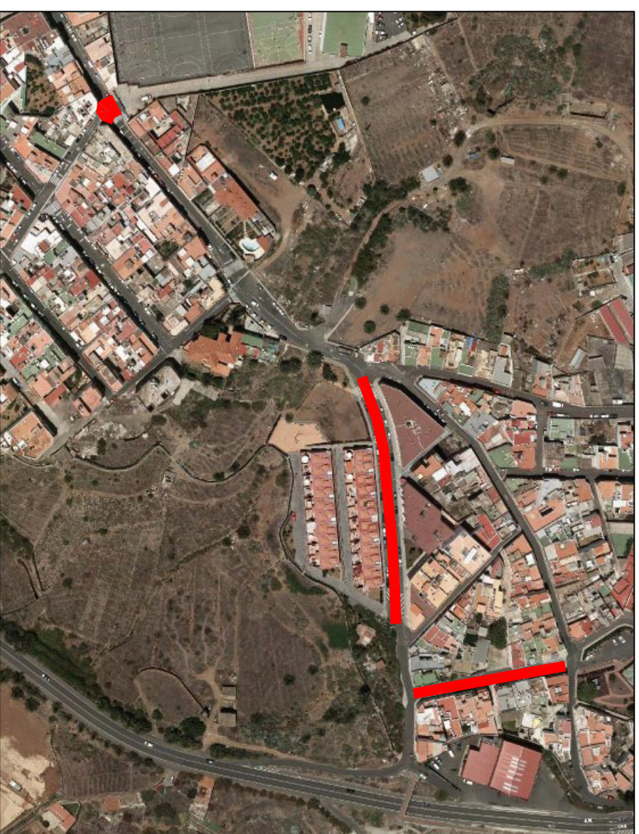
EL TERRERO - HOYA DE SAN JUAN, PLANO 2