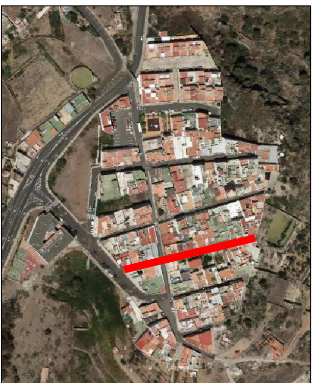
LA MONTAÑETA, PLANO 5