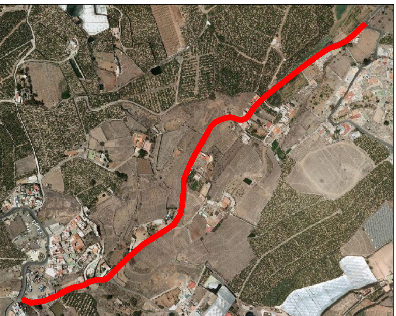
CAMINO DEL PARRALILLO, PLANO 11