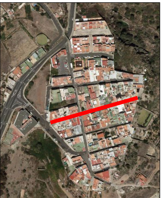
LA MONTAÑETA, PLANO 3