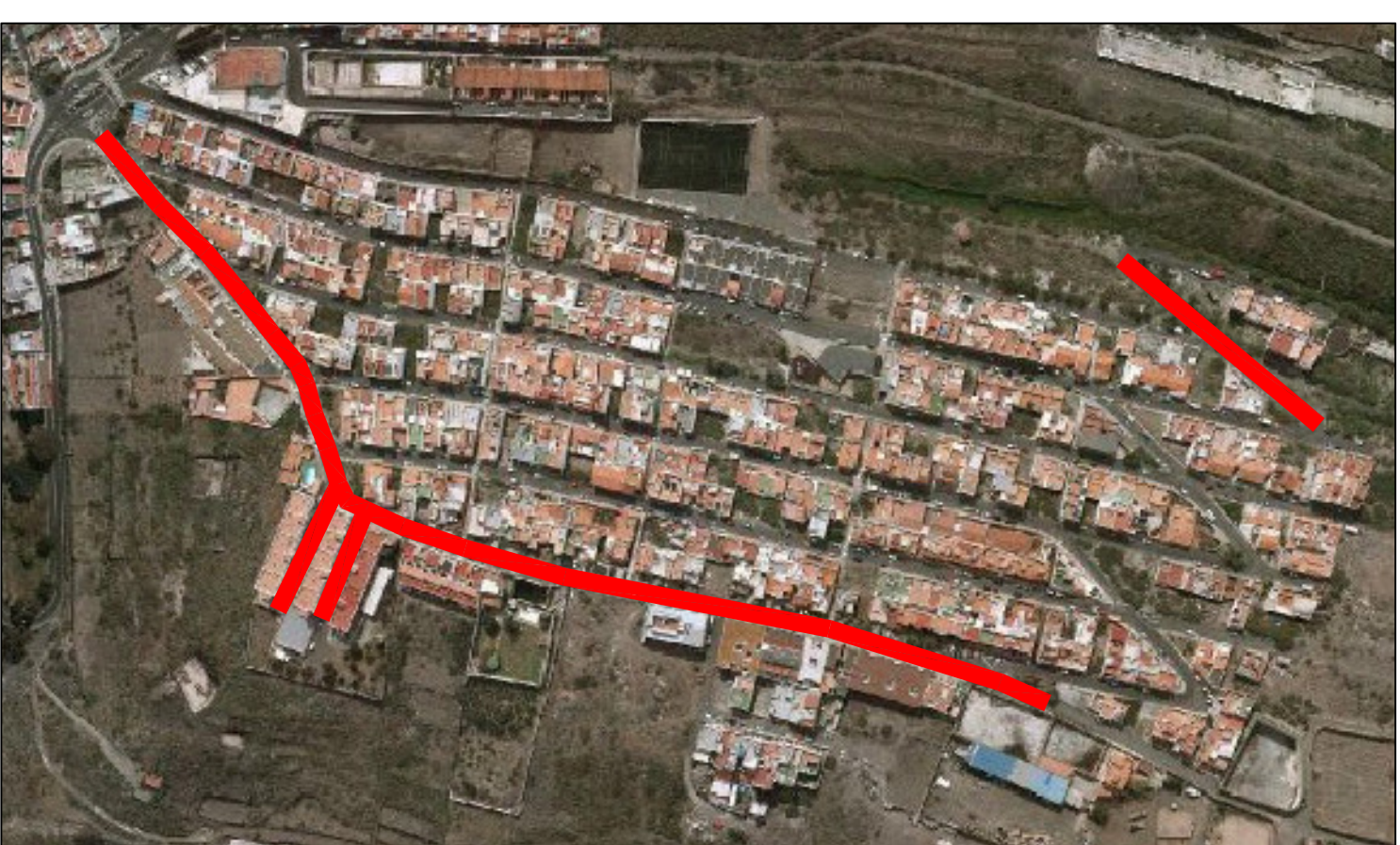
URB. SAN FRANCISCO JAVIER, PLANOS 4 Y 6