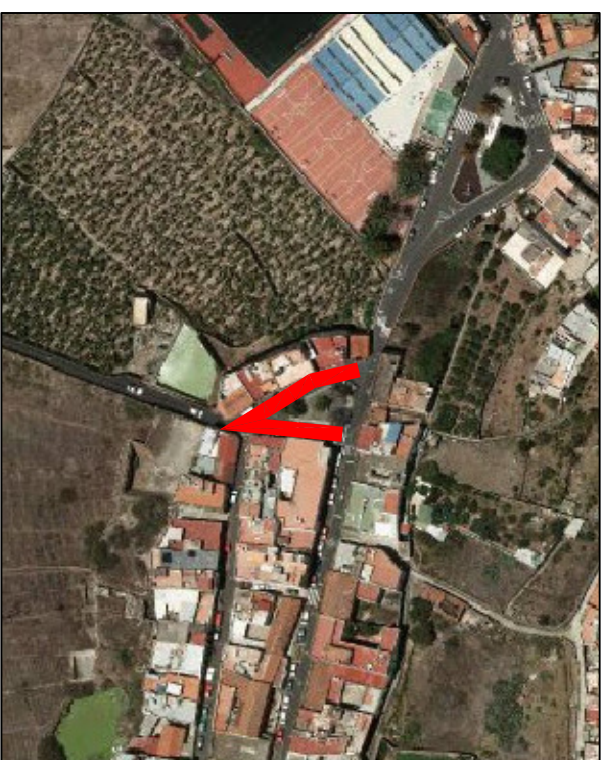
EL CERRILLO, PLANO 2